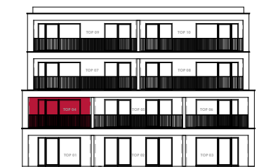
Südsicht Haus 5